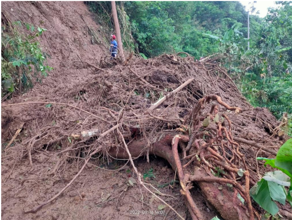
Jln. Singkup Dusun Bojongkondang Desa Bojongkondang Kecamatan Langkaplancar