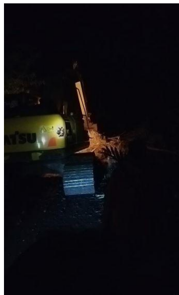
Pembersihan matrial tanah yang menutupi jalan menggunakan Alat berat