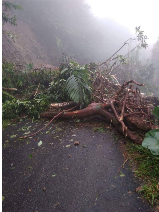
Foto kejadian Longsor Jln. Singkup Dusun Bojongkondang Desa Bojongkondang Kecamatan Langkaplancar